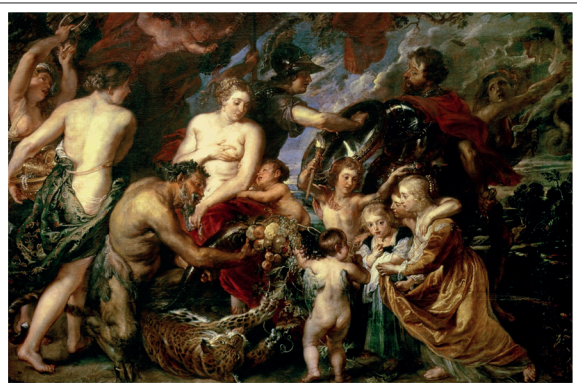
Minerva protegge la Pace da Marte Pieter Paul Rubens (1629-1630) National Gallery, Londra