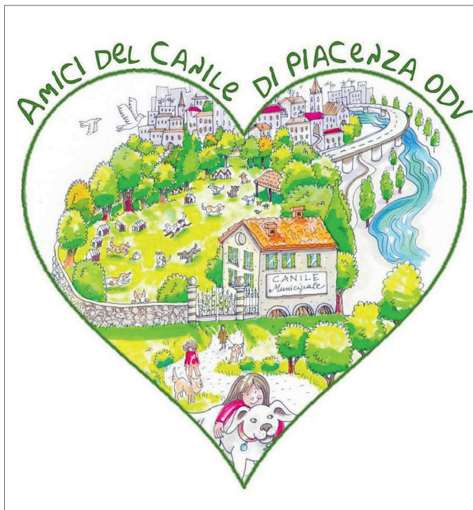
Il logo dell'associazione e, a destra, il frutto di una delle raccolte cibo organizzate periodicamente